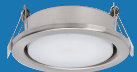
4 MT76351 Eisen gebürstet