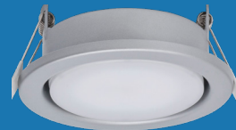
3 MT76341 Silber