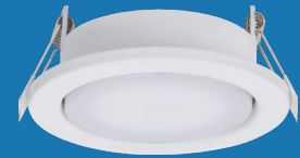
1 MT76301 Weiß

Hochwertiges Metallgehäuse | Geringe Einbautiefe | Blendfreies Licht