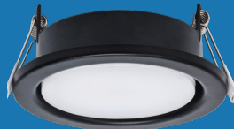
2 MT76331 Schwarz