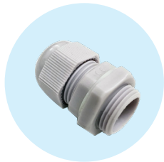
M20-Verschraubung für größere Kabeldurchschnitte