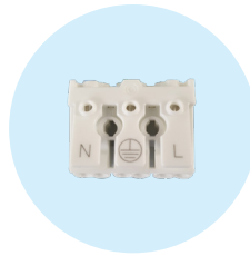
Steckklemmen für schnelle Montage