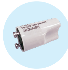
Zusätzlicher Schutz durch 2A-Sicherung (inklusive)